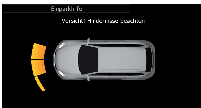
Einparkhilfe (Park Distance Control)