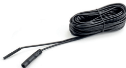
extension cable (AK1020)