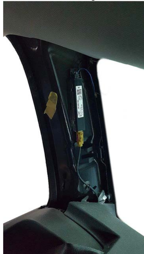
AM / FM1