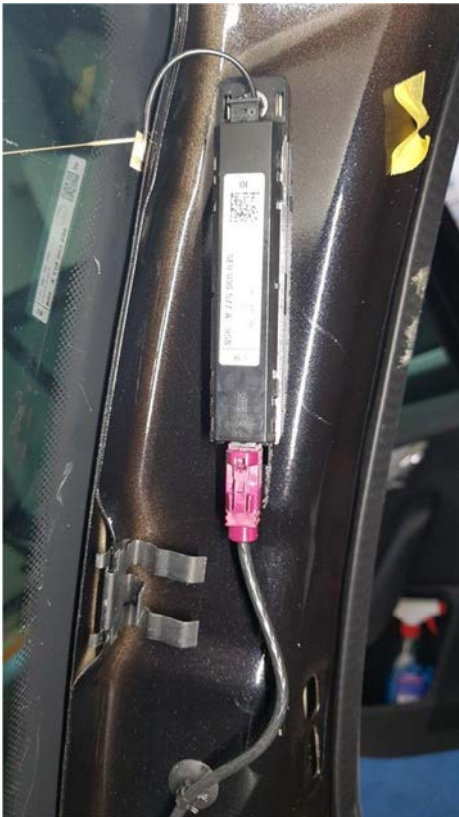
FM2 / DAB