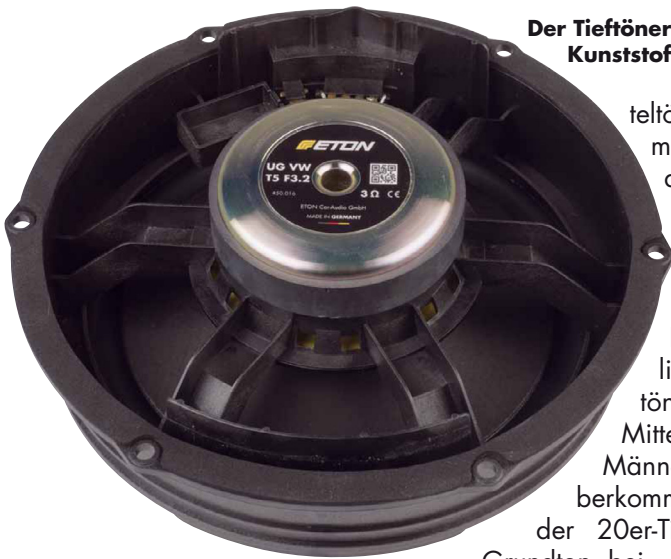
Der Tieftöner sitzt in einem faserverstärkten Kunststoffkorb speziell für den T5

den Universalsystemen der POW-Serie kennt. Wie gewohnt verschließt eine Gummi-Dustcap das Loch in der Mitte. Der Antrieb arbeitet mit hübsch bearbeiteten Polplatten und einer 25-Millimeter-Schwingspule. Alle drei Töner sind wie bei Eton üblich Made in Germany, worauf man natürlich besonders stolz ist.