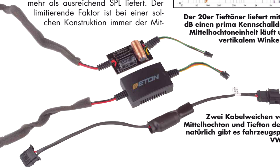
Zwei Kabelweichen versorgen Mittelhochton und Tiefton des T5 3.2, natürlich gibt es fahrzeugspezifische VW-Stecker

BEST PRODUCT VW-Lautsprecher CAR&HiFi 4/2022