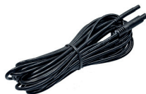
extension cable (AK1013)