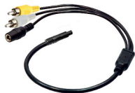
adapter cable (AK1011)